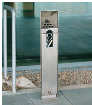
Ashguard™ Fristående askkopp