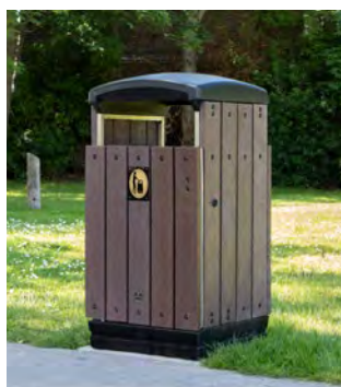
Enviropol 100™ Papperskorg