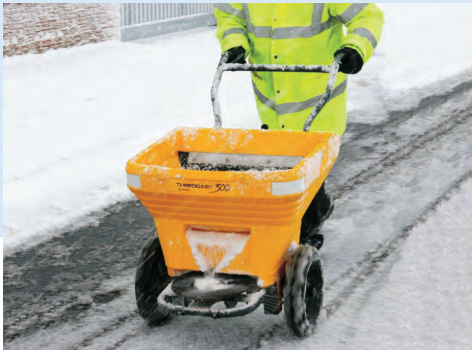
Cruiser™ 300 Sandspridare

Att salta och sanda dina områden under vintermånaderna är en viktig del i väghållningen. Vi levererar en mängd olika sandspridare som är handdrivna eller går att bogsera bakom fordon samt ett flertal sand- & gruslådor för att passa de olika behoven.