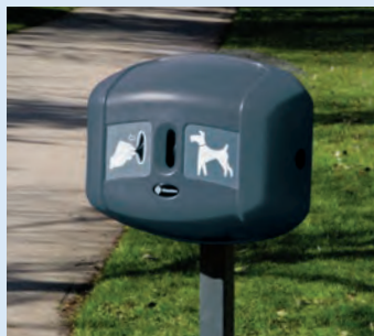
Retriever City™ Hundpåseautomat