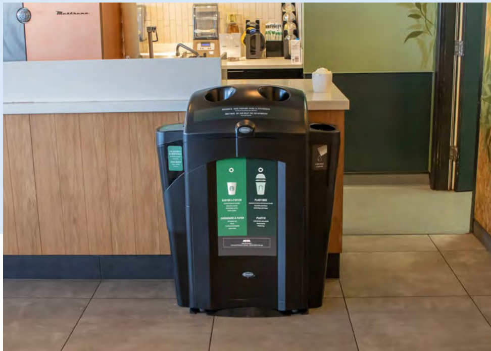
Nexus® 100 Duo-Återvinningsstation

Vi kan hjälpa dig att införa ett effektivt återvinningsprogram för muggar med hjälp av våra dedikerade och mångsidiga lösningar som är utformade för att hjälpa dig öka din nivå av återvinning samt spara pengar på din avfallshantering.