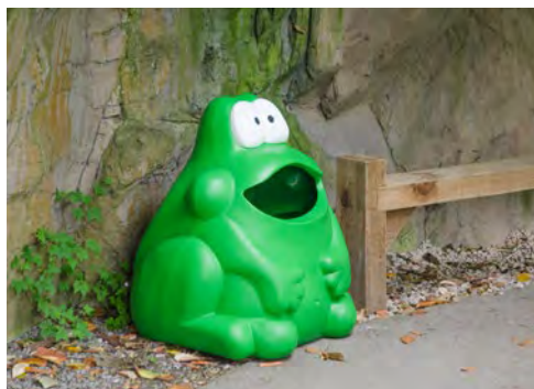
Groda Froggo™ Papperskorg