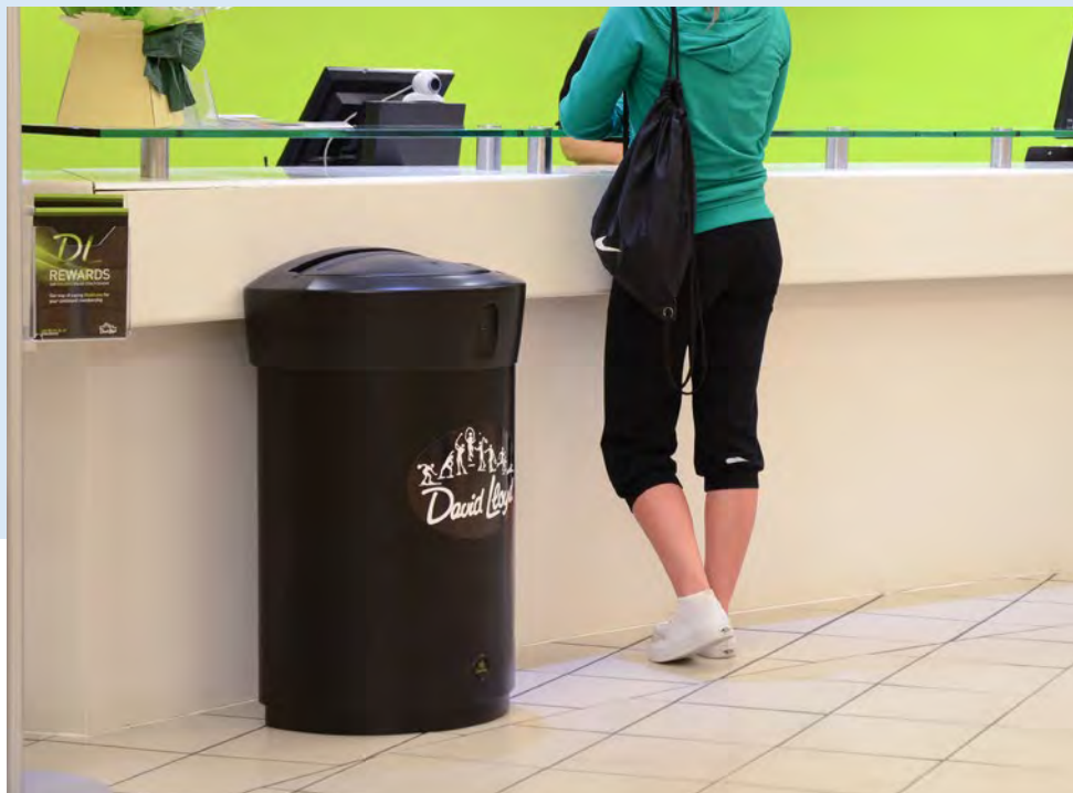
Envoy™ 110L Papperskorg

Vi har ett urval av snygga och praktiska papperskorgar tillverkade i högkvalitativa material för att garantera en lång livslängd. Du hittar behållare i en mängd olika stilar, färger och storlekar för att kunna matcha dina behov och hitta en lösning som kompletterar dina lokaler.