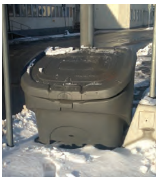
Nestor™ 400L Sandlåda