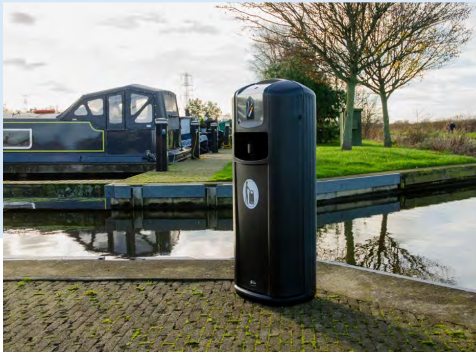
Integro City™ Papperskorg med askkopp

Inom vårt sortiment av askkoppar finner du fristående och vägg/stolpmonterade modeller. Vi kan även leverera de flesta av våra papperskorgar med askkopp på för att reducera nedskräpning av fimpår.