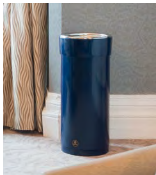
Senior Ambassador™ Papperskorg