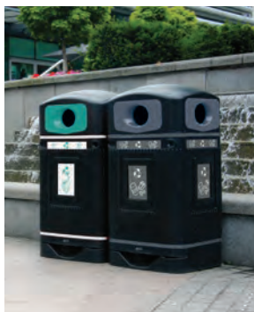
Sopsorteringskärl Glasdon Jubilee 110™