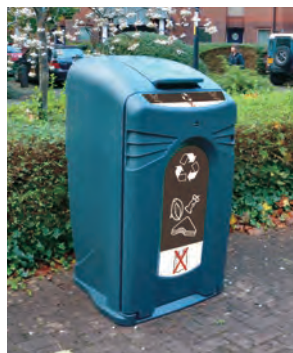
Sopsorteringskärl för matavfall Nexus® City 240