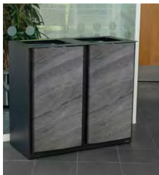
Nexus® Style 170 Duo Källsorteringsbehållare