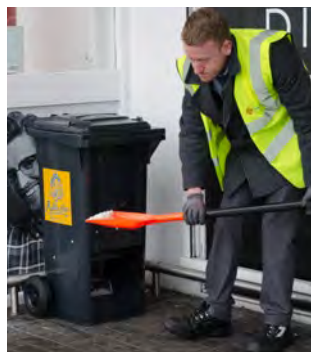
Rollastor™ Sandbehållare på hjul med snöskyffel