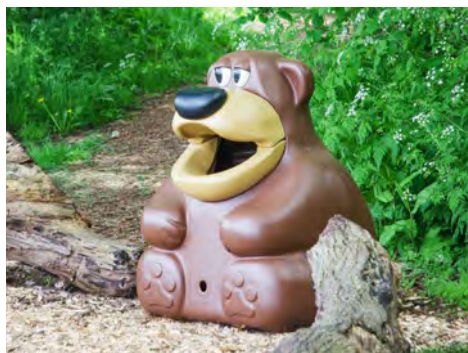
Björn TidyBear™ Papperskorg