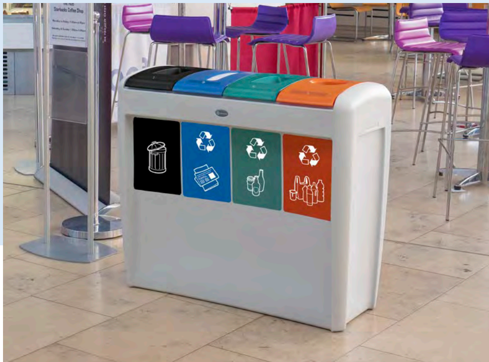
Nexus® Evolution Quattro Källsorteringsbehållare

Glasdon designar och tillverkar ett brett sortiment av återvinningskärl som utformats speciellt för kontor, skolor och köpcenter. Vi erbjuder ett brett utbud av behållare i olika storlekar, stilar och utseenden för att passa in i olika miljöer med olika behov.