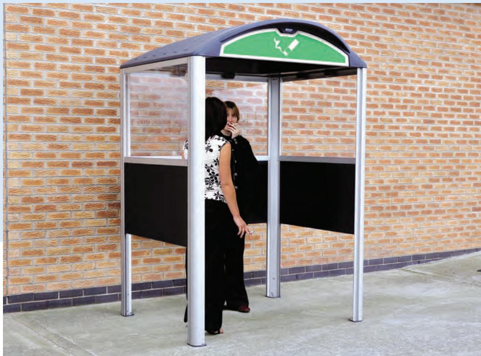
Rökkur, väntkur, väderskydd Modus™

Glasdon producerar en mängd väggmonterade skyddstak och rökkurer. Idealiska för användning utomhus utanför till exempel kontorsbyggnader, restauranger och barer. Skyddstak och rökkurer hjälper till att skydda mot väder och vind. De är robusta i konstruktionen vilket gör att de kommer motstå vandalism och korrosion.