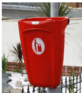
Super Corbi 50™ SL Papperskorg