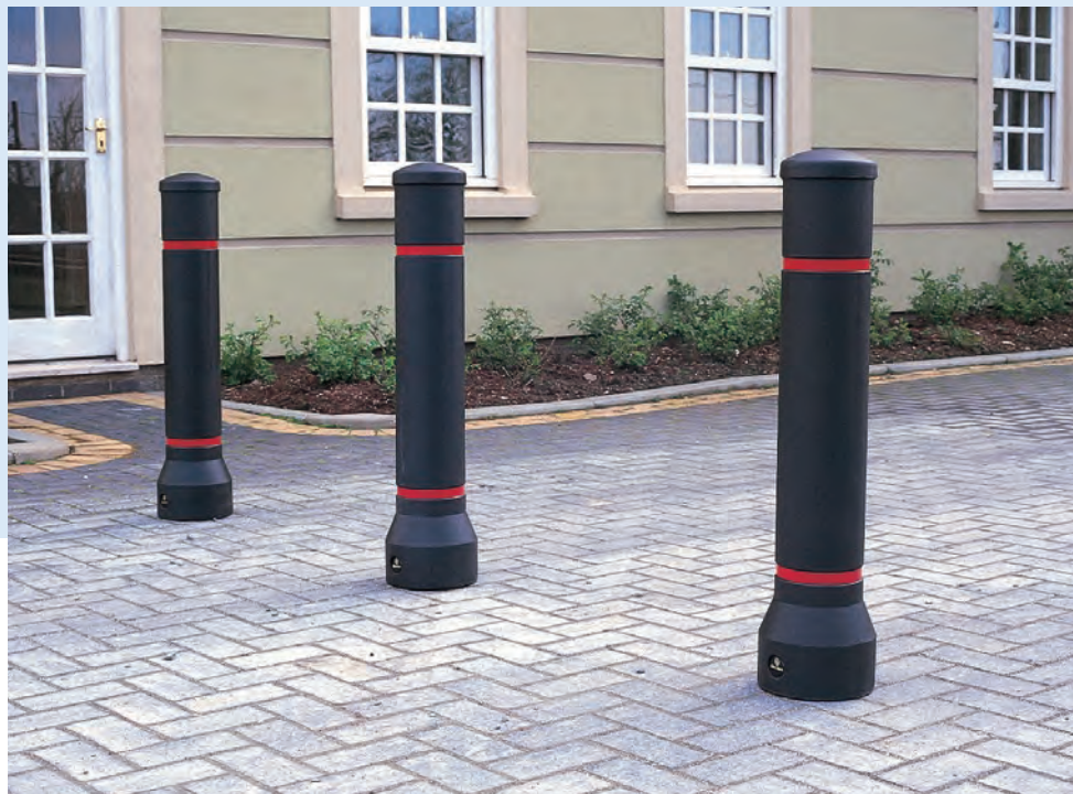
Neopolitan™ 150 Pollare

Vårt sortiment omfattar ett brett utbud av trafikpollare, kantstolpar och skyltar så som andra trafikledningsprodukter. Många av våra pollare finns också i en flexibel modell som innebär att de böjer sig vid en kollision.