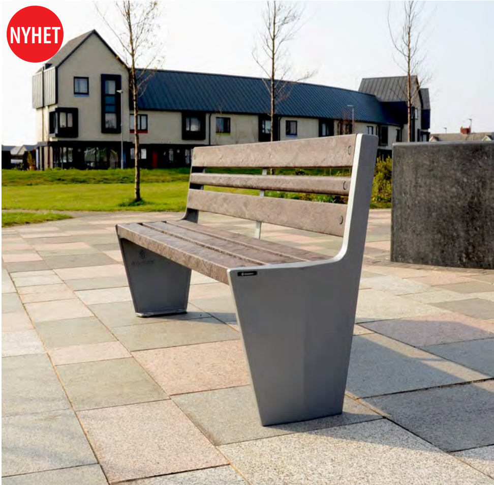
NYHET Vistra™ Parksoffa