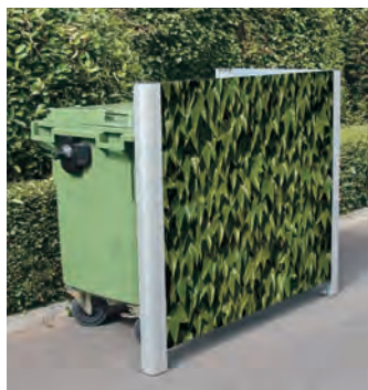
Cache conteneurs Visage™