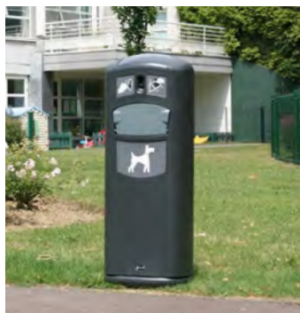
Retriever City™ Hundlatrin med dispenser för hundpåsar