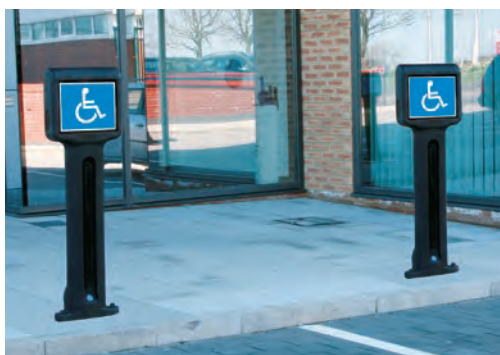
Infomaster™ Pollare med skylt