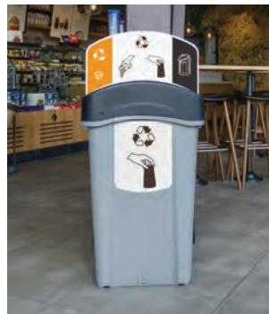
Eco Nexus® Återvinningsstation för bägare