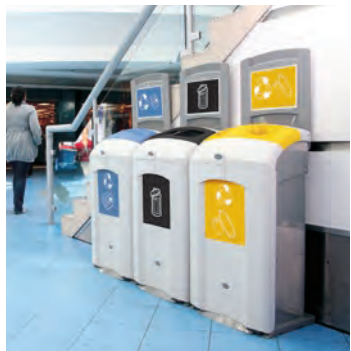
Nexus° 100 Källsorteringsbehållare