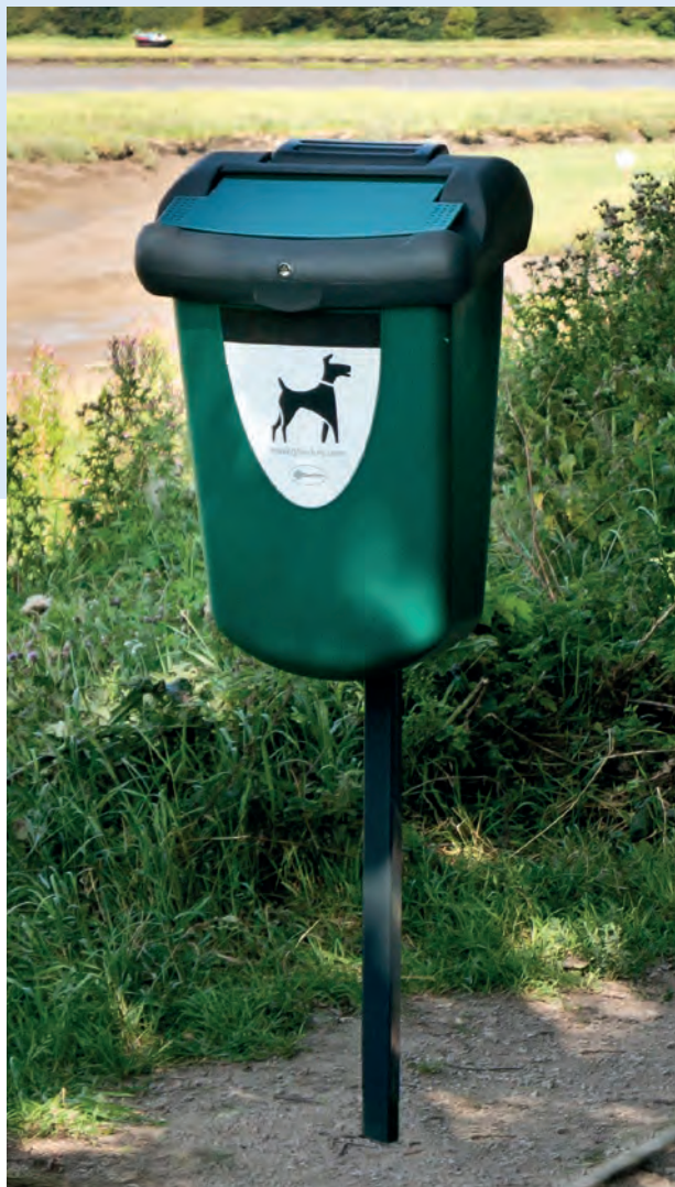
Retriever 35™ Hundlatrin

För att hjälpa till med att hålla gator, parker och andra allmänna utrymmen fria från hundavfall producerar vi en mängd olika hundlatriner som är extremt hållbara och slitstarka. Vi har både fristående och vägg/stolpmonterade behållare i vårt sortiment för att kunna erbjuda en produkt som matchar dina behov samt uppmuntrar hundägare att plocka upp efter sina hundar.