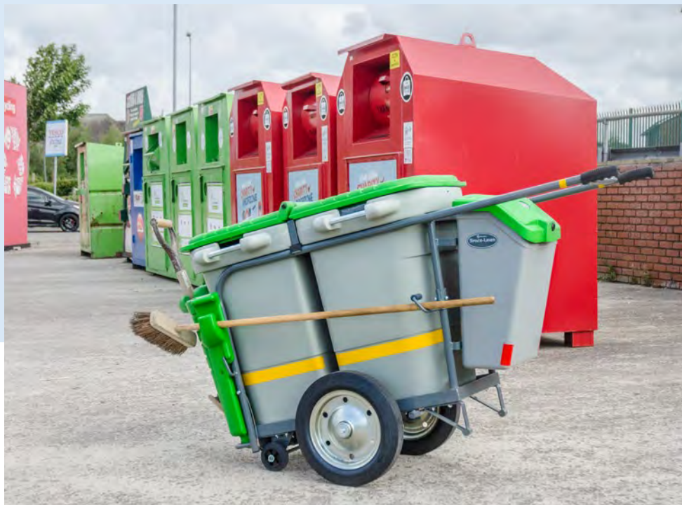
Space-Liner™ 200 liter Sopvagn

Glasdon tillverkar en rad olika städvagnar som hjälper till att skapa effektiva avfallslösningar för distribuering i både inomhus- och utomhusmiljöer. Våra sopvagnar är tillverkade av robusta material som klarar av väder och vind, vandalism och daglig användning, för att säkra produktens långa livslängd.