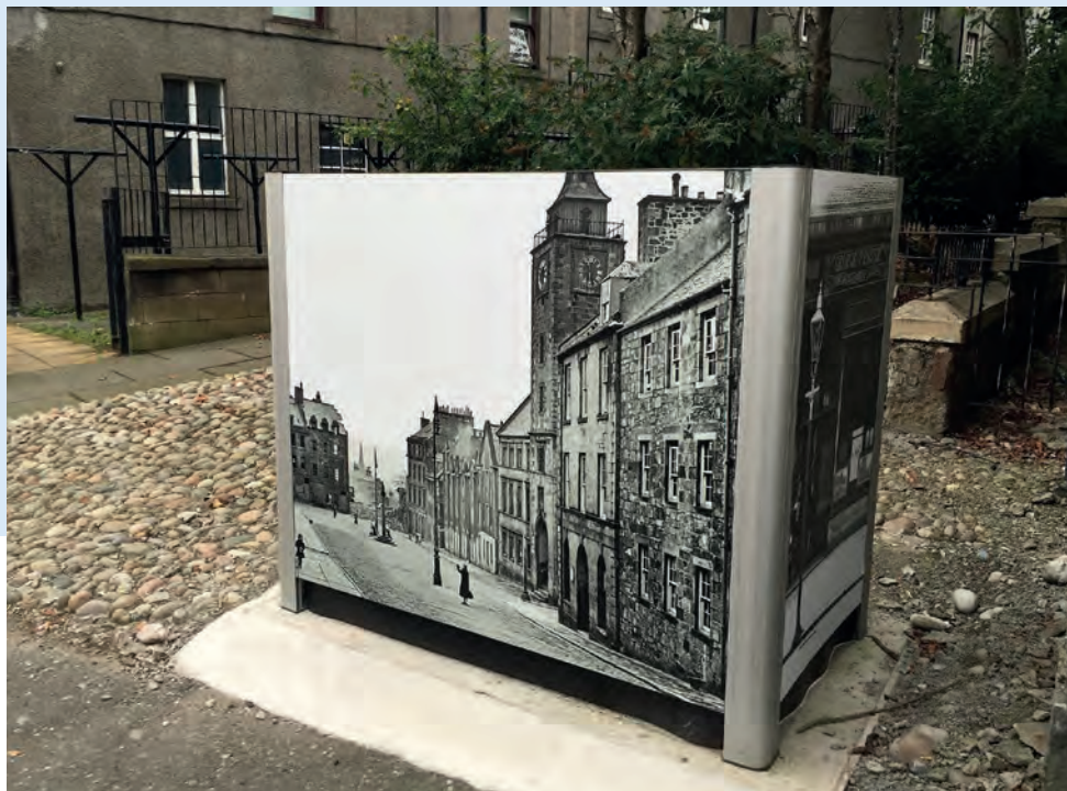
Visage™ Skärmvägg för rullkärll

För avfall i större volymer användes oftast rullkär, för dessa har Glasdon i sitt sortiment ett urval av skärmskydd och kärlskåp som rymmer kärll upp till 1 280 liter.