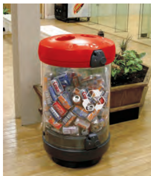
C-Thru™ 180 Källsorteringsbehållare