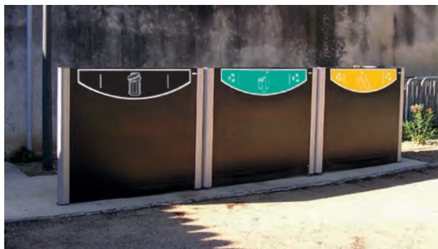
Cache conteneurs Visage™