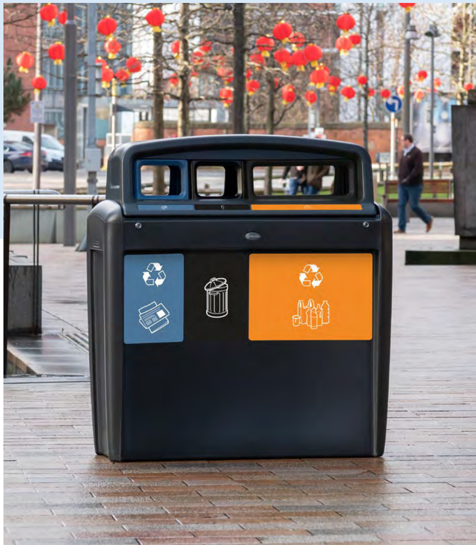
Nexus® Evolution City Trio Källsorteringsbehållare

Glasdon designar och tillverkar ett brett sortiment av miljövänliga återvinningskärl för utomhusbruk av högsta kvalitet i traditionell och modern design.