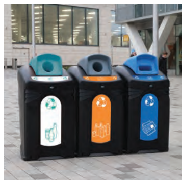
Nexus® City 240 Återvinningskärl