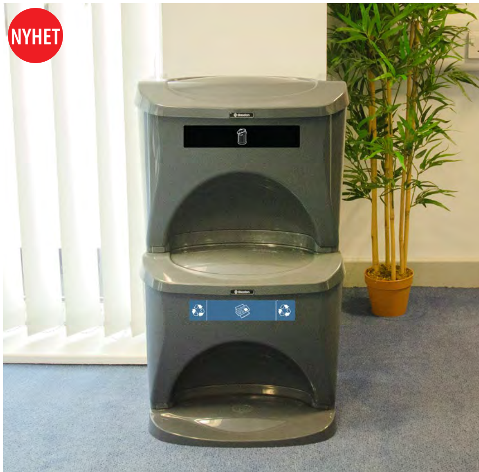
Nexus° Stack Källsorteringsbehållare