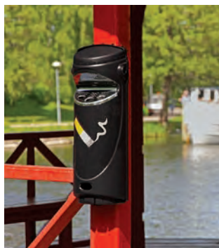
Ashmount SG™ Askkopp för vägg