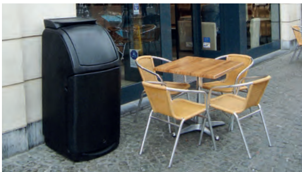
Combo™ Papperskorg med brickställ