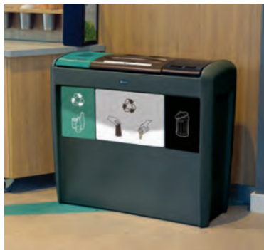
Nexus® Evolution Källsorteringsbehållare för bägare