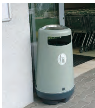
Topsy® 2000 Papperskorg