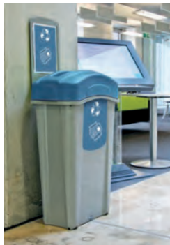
Eco Nexus° Källsorteringsbehållare