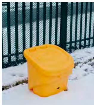
Nestor™ 90L Sandlåda