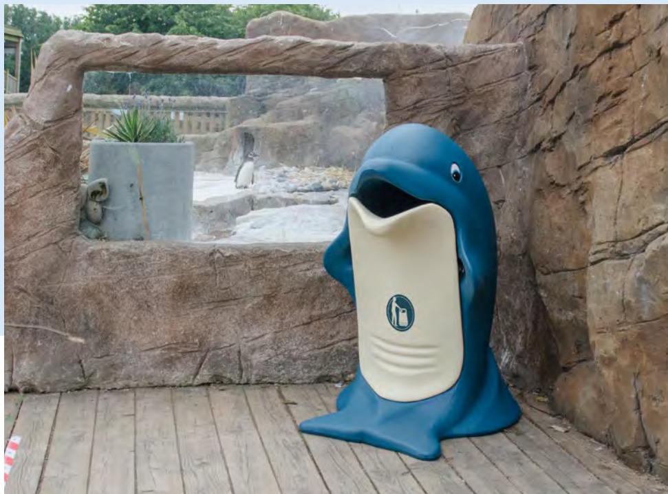
Delfin Splash™ Papperskorg

Vi tillverkar en serie av papperskorgar i djurform, idealiska för både inomhus- och utomhusmiljöer. Formen och färgerna uppmuntrar barn att sortera och återvinna sitt avfall på rätt sätt.