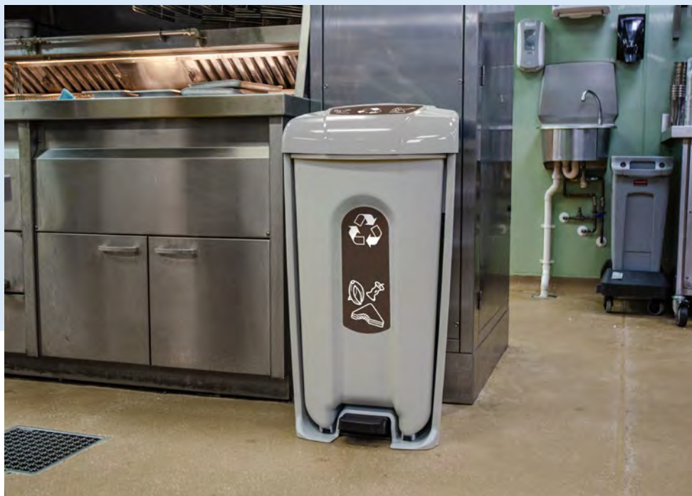
Nexus® Shuttle Papperskorg

Dessa avfallsbehållare är avsedda för miljöer där mat tillreds eller konsumeras. Med alternativ som pedalstyrt lock, stora inkastöppningar samt hygienisk behållare för matavfall kan du enkelt hitta något som passar för dina behov.