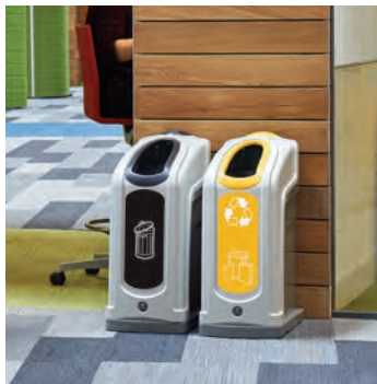
Nexus° 50 Källsorteringsbehållare