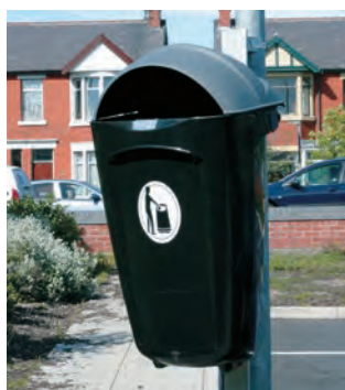
Super Corbi 50™ HSL Papperskorg