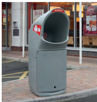
Combo Delta™ Papperskorg