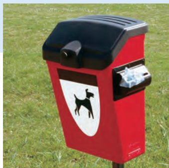
Fido 25™ Hundlatrin