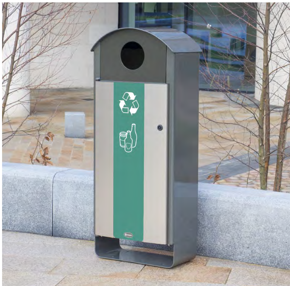
Electra™ Curve 60 Sopsorteringskärl