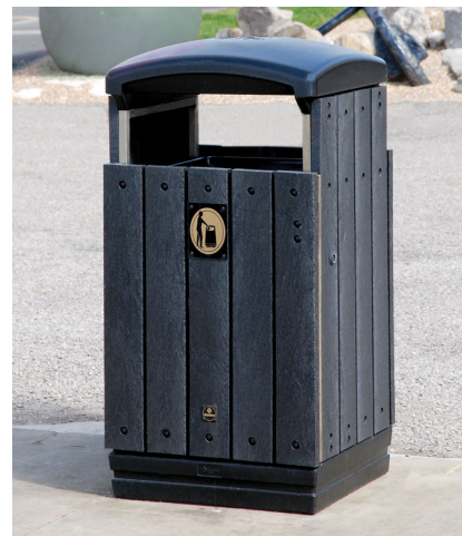
7. Papperskorg Enviropol™ 100